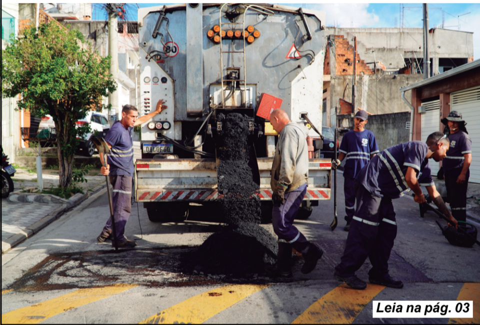
Leia na pág. 03

Prefeitura de Caieiras realiza serviços de infraestrutura e zeladoria em vários bairros