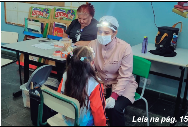
Leia na pág. 15

Francisco Morato promove Programa Saúde na Escola