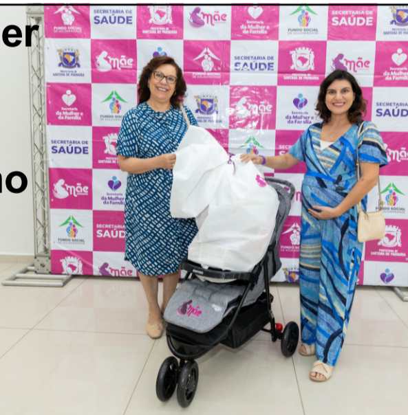
Leia na pág. 13

Prêmio Mulher Inspiração reconhece o protagonismo feminino em Santana de Parnaíba