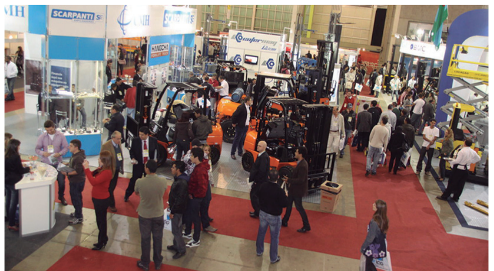
Leia na pág. 08

Referência em logística, Jundiaí sedia mais uma edição da BRASIL LOG, um dos principais eventos do setor no país