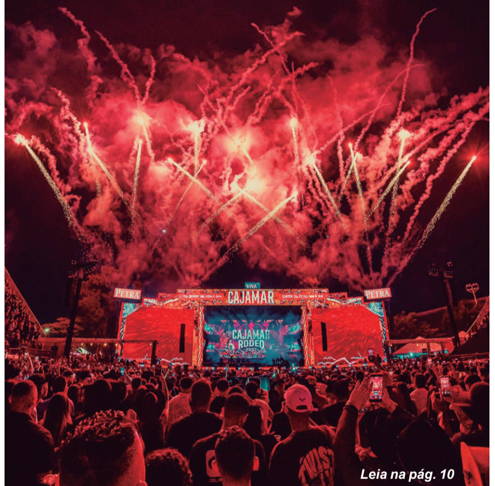
Leia na pág. 10

Cajamar Rodeo Fest 2026 reúne multidões e marca edição histórica no município