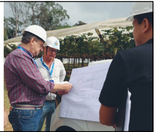
Leia na pág. 19

DAE leva mais de 14 km de rede de esgoto e beneficia 350 famílias no Poste e Traviú