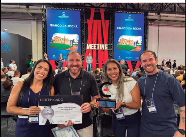
Leia na pág. 17

Franco da Rocha conquista Prêmio Cidade Esportiva do Estado de São Paulo 2026